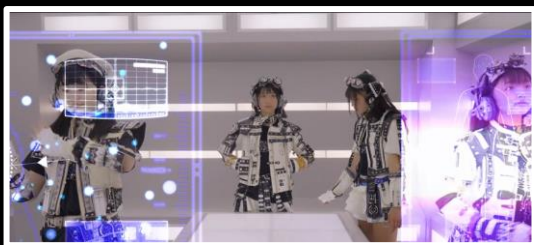
VFXを多用したミュージックビデオ。