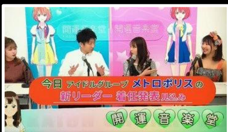
TBS「開運音楽堂」にも出演しました。