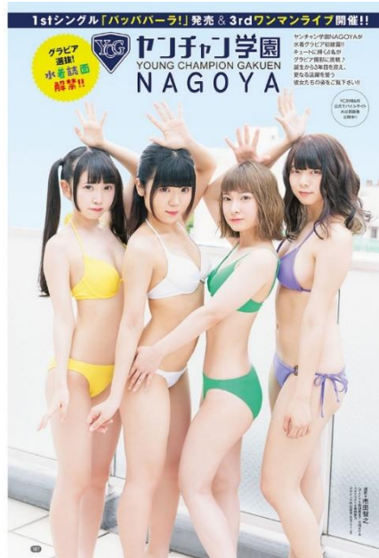
ヤンチャンNAGOYA ヤングチャンピオン烈 2020.8号掲載