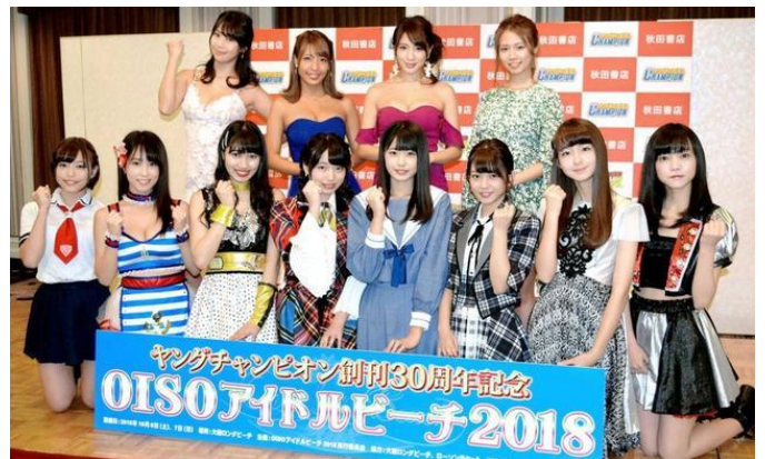
OISOアイドルビーチ2018プレスイベント 2018.9.25 ホテルグランドパレスにて