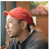
写真家 松井 良寛

ボイストレーナー、作詞家、プロデューサー。理論に基づく実践的な指導は評価を得て、当時勤務していたボイストレーニングスクールで稼働率、指名率、レッスン数ともに3年間ナンバーワンを維持。またアイドルのオーディション審査員や、プロデュースの実績を経て、近年はアイドル（ソロ、グループ問わず）の指導にも定評がある。